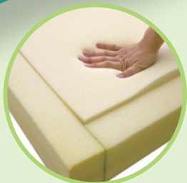
低反発ウレタンフォーム