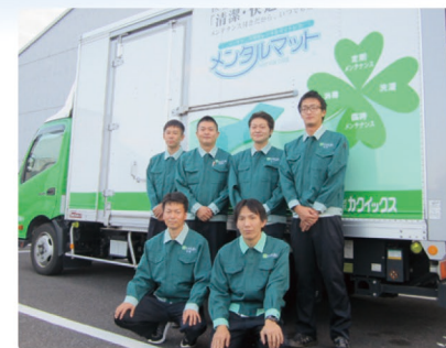
マットレスの配送スタッフ(本社)

病院で療養中の患者様にとって、病室のベッドは回復までの日々を過ごす大切な場所。だからこそ、ベッドのマットレスには、優れた医療技術や医療機器と同様、常に最高のクオリティが求められます。カクイックスでは、シーツの下の見えないところまで清潔にすることで、安心・快適な環境づくりをサポートいたします。