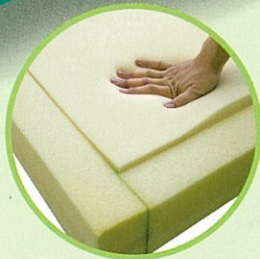
低反発ウレタンフォーム